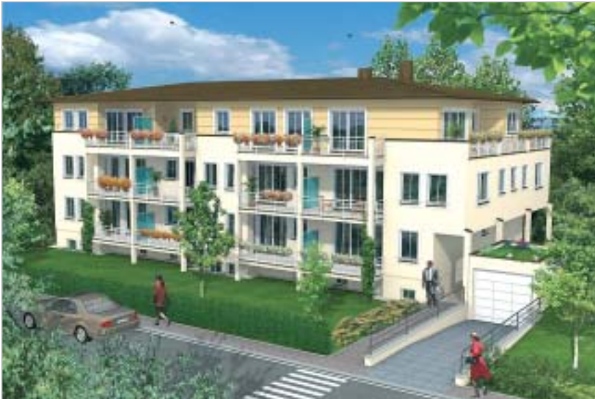
Eigentumwohnanlage in München Freimann

Mehrfamilienhäuser stellen besondere Anforderungen an Qualität und Wirtschaftlichkeit des Wandbaustoffes.